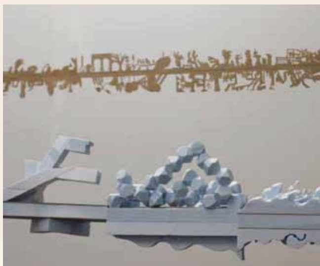
O Rio Voador – março de 2012

O Mondego é um rio com uma dimensão mítica na cultura e na história de Portugal. Sendo o maior dos rios portugueses (daqueles que nascem e desaguam em Portugal), é aquele que mais foi cantado pelos poetas portugueses. Nessa sua dimensão mítica, de símbolo da portugalidade, convém não esquecer que, nascendo na Serra da Estrela, o Mondego se precipita a grande velocidade em direção a Espanha para, numa inflexão repentina, que muitos retratariam como racional, se arrepender do rumo que seguia e se espriar no mar português. Nesse seu percurso encontra Coimbra, a cidade que com ele se confunde e onde estudaram muitos dos poetas que o cantaram.